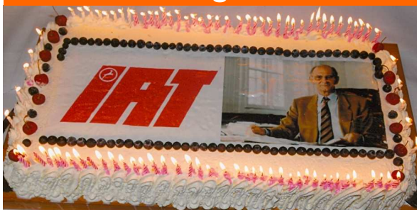
En flot kage til en mand med en "sød tand".